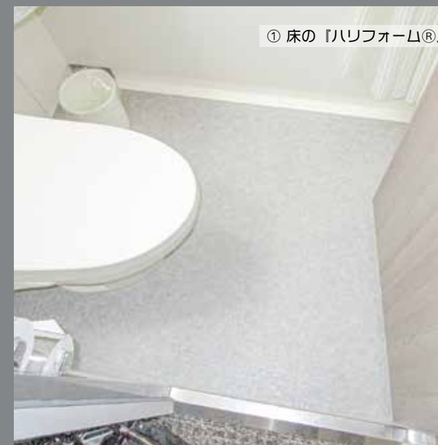
① 床の『ハリフォーム®』