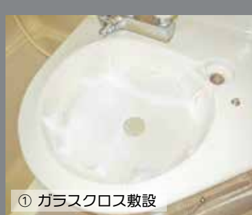
① ガラスクロス敷設