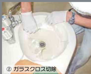
② ガラスクロス切除