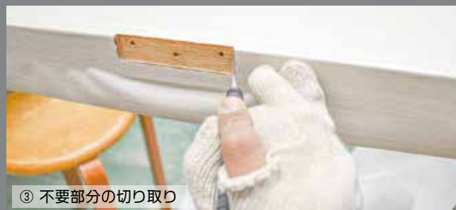
③ 不要部分の切り取り